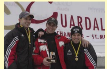
...und nochmals ein strahlendes Trio

Athleten geöffnet sind. Nebst den «Stammgästen» aus Deutschland und Österreich fungierten in den letzten Jahren auch US Amerikaner/innen und eine Finnin auf den Startlisten! Die Rennserie über alle 4 Rennen heisst «Engadin Grand Prix». Preisgeld wird hier keines ausgeschüttet.