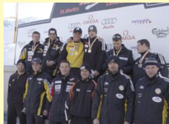
Siegerpodest der «Ueli Koch Silvestertrophy»