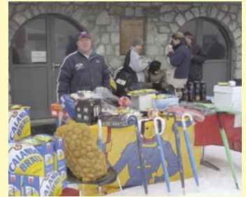
Der reich gedeckte Gabentisch des «Polenta Race» - ein gemütlicher Anlass mit Rennatmosphäre und Polentaessen für jedermann.