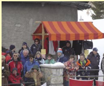
An jedem Rennen mit dabei - die Souvenirverkäuferinnen dürfen nicht fehlen (links aussen)

Die Highlights jeder Bob und Skeleton Saison stellen die Weltcup Rennen und Schweizermeisterschaften dar. Doch sind dies nicht die einzigen Wettkämpfe die stattfinden und der Besuch der kleineren Anlässe lohnt sich alleweil.