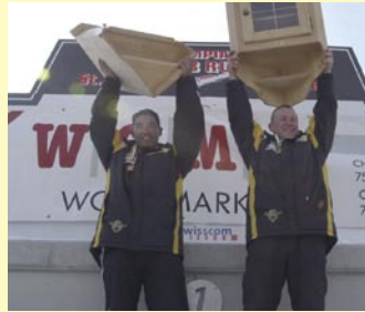
Die glücklichen Sieger des WOMA-Race - in diesem Fall gestandene Bobprofis

Ähnlich im Skeleton. Hier hat sich schon früher rumgesprochen, dass die Cuprennen auch für ausländische Athletinnen und